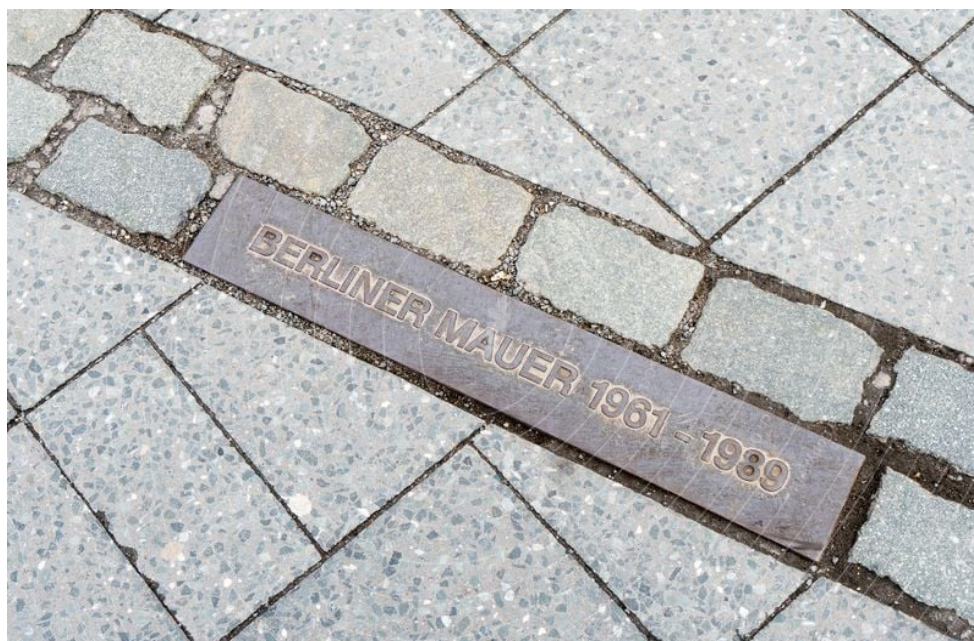
Фиг. 1 Маркер в тротоарна настилка, бележещ Берлинската стена

Въпреки това, растерът на настилката не е достатъчен сам по себе си, за да информира пешеходците, че тези акценти в него, бележат именно исторически контекст. Пример за подход, осигуряващ такъв, може да се намери в Берлин, където демонтираните отсечки от Берлинската стена са маркирани с два непрекъснати реда гранитни павета и метални плочи, поставени на регулярно разстояние една от друга в зоните, където силуета на Стената може да бъде възприеман от пешеходците. Така те дават информация, че Стената се е издигала на тази локация (Фиг. 1).