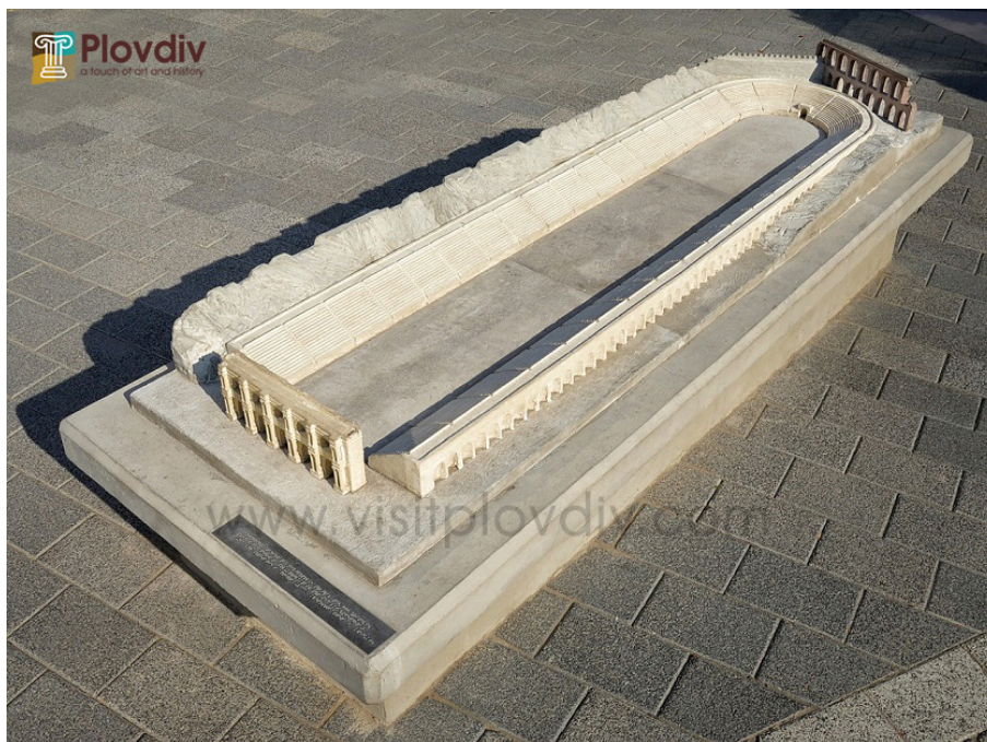
Фиг. 3 Макет на Пловдивския стадион на пл. Римски стадион

Пример за подобни макети, изложени in situ могат да се намерят както в чужбина, така и в България. Например на пл. Римски стадион в Пловдив е поместен макет на Пловдивския стадион (Фиг. 3), пресъздаващ в мащаб експонираните разкопки, както и допълнителни конструкции, загатнати в експонирания слой. Той е изработен от бетон, което го предпазва както от вандализиране, така и гарантира дълготрайност.